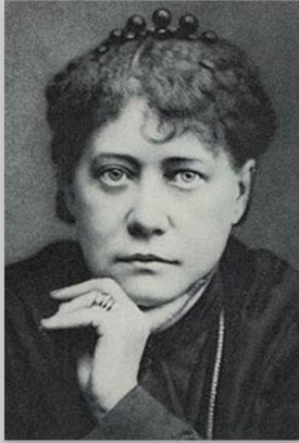
Helena Petrovna Blavatsky

Conocida como Madame Blavatsky, fue una mística y autora rusa y estadounidense que cofundó la Sociedad Teosófica en 1875